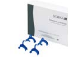
Pack RETRACTOR BUCAL Ref. 11040 · 10 ut.