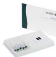
Pack produit SMILECARE Ref. 11038 · 5 doses 8 traitements approx.