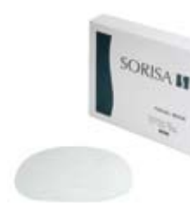
Pack produit LIFTCARE Ref. 11031 · 3 boîtes x 12 masques