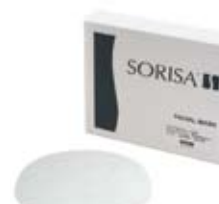
Pack produit WRINKLECARE Ref. 11030 · boîtes x 12 masques