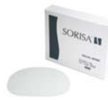
Pack produit LIGHTCARE Ref. 11028 · boîtes x 12 masques