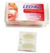
Led-aid. Boîte 50 occluseurs Ref. 11025 · 1 ut.