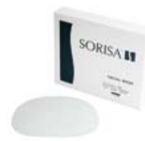
Pack produit HYDROCARE Ref. 11027 · 3 boîtes x 12 masques