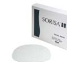
Pack produit ACNECARE Ref. 11029 · boîtes x 12 masques