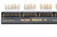
Guide couleur Ref. 11051 · 1 ut.